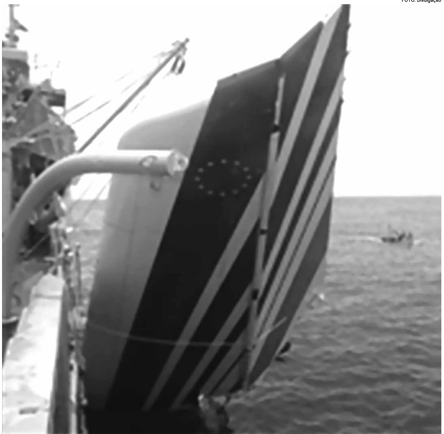
Imagem divulgada pela Marinha do Brasil mostra pedaço do voo da Air France, içado por um navio de salvamento no Oceano Atlântico

A zona em que a operação está concentrada é remota e alvo de fortes correntezas e mau tempo, o que compromete as chances de sucesso.