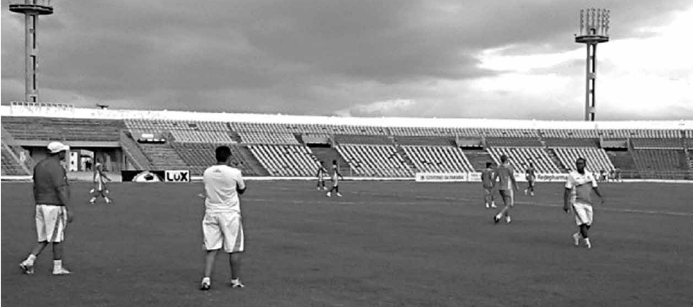
A Raposa, sob o comando do técnico Freitas Nascimento, fez o último treino antes do jogo, no Estádio Amigão, pensando exclusivamente na segunda vitória do retorno buscando vaga no G-2