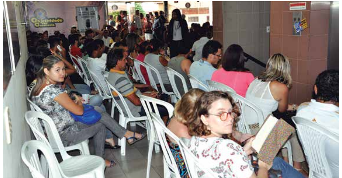
Eleitores retardatários receberam senhas para fazer o cadastro biométrico ontem à tarde

Além de João Pessoa, a biometria aconteceu nos municípios de Aguiar, Boa Vista, Caiçara, Campina Grande, Capim, Catingueira, Cuité de Mamanguape, Emas, Igaracy, Itapororoca, Lagoa Seca, Logradouro, Mamanguape, Massaranduba, Mataraca, Nova Olinda, Olho D'água e Serra da Raiz. O último cadastramento eleitoral na Paraíba foi realizado em 1986.