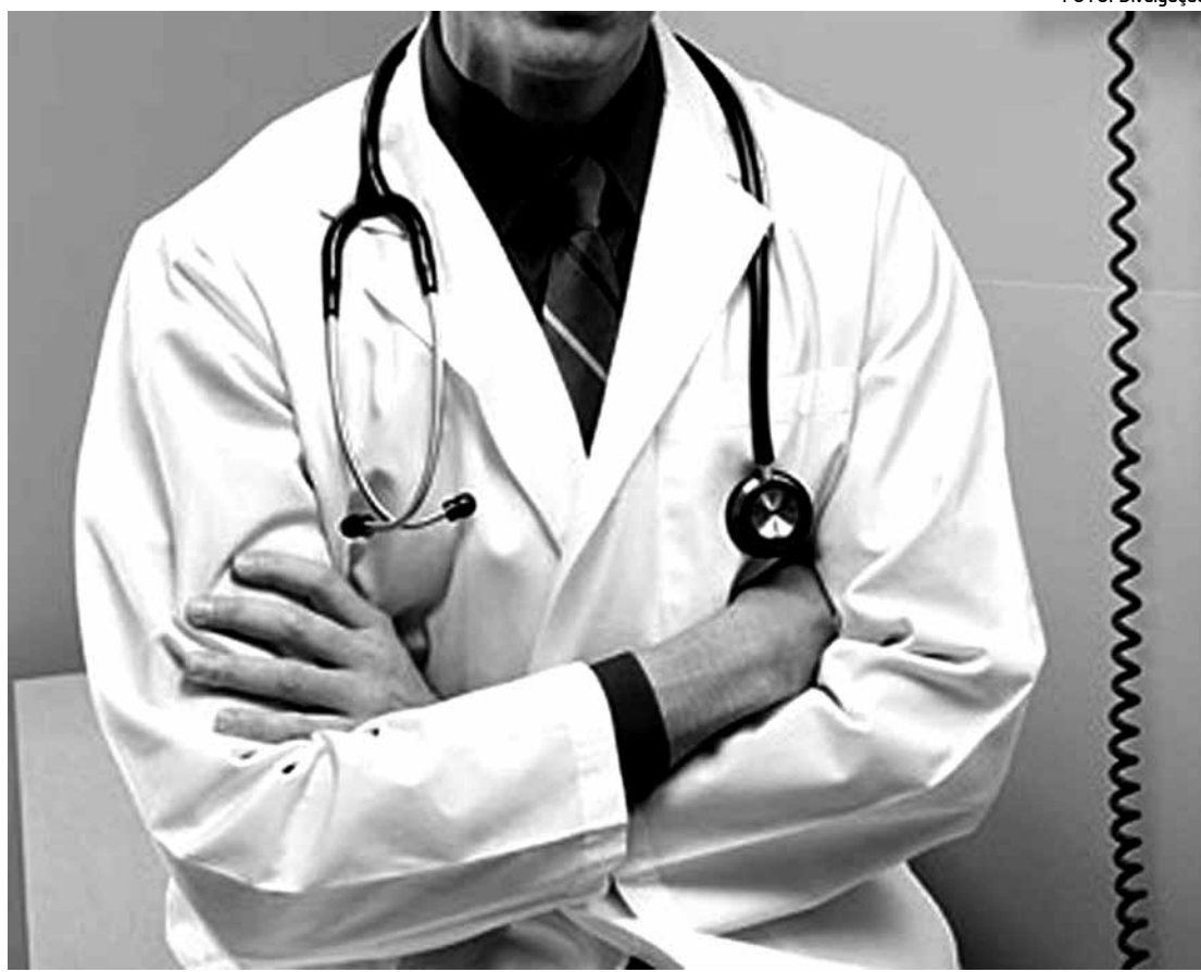
Especialização de médico que presta serviço por meio de plano deve ser informada aos beneficiários

É importante destacar que é de responsabilidade das operadoras conferir a veracidade e a procedência das informações fornecidas por seus prestadores de serviços de saúde antes da divulgação em seus canais. As operadoras que deixarem de incluir os atributos de qualificação informados por seus prestadores no prazo estabelecido poderão ser multadas em 35 mil reais.