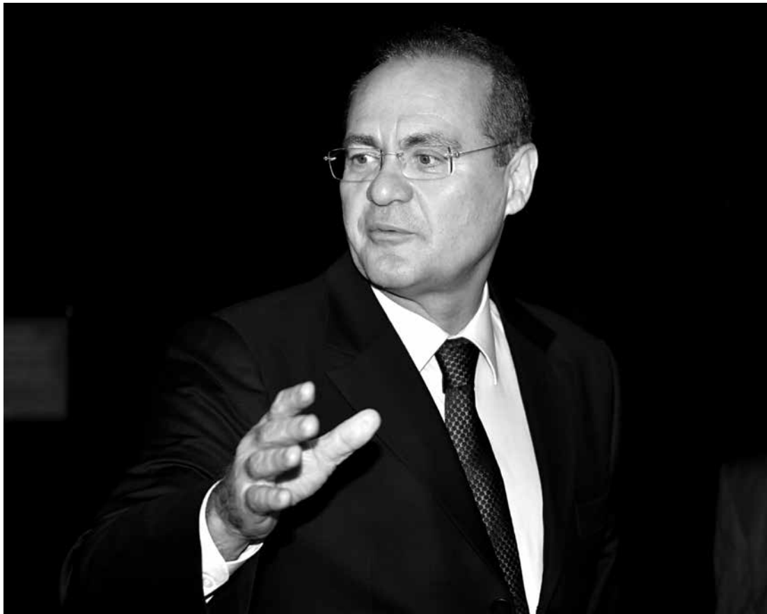
Renan Calheiros criticou recentes episódios em que jogadores de futebol foram discriminados

Renan Calheiros (PMDB-AL) considerou nefastos os atos de discriminação ocorridos recentemente em estádios de futebol. O senador ressaltou ainda que o preconceito ocorre muitas vezes de forma velada. "Permeando e se imiscuindo nas relações interpessoais, a discriminação racial e os preconceitos são acintosos e demandam