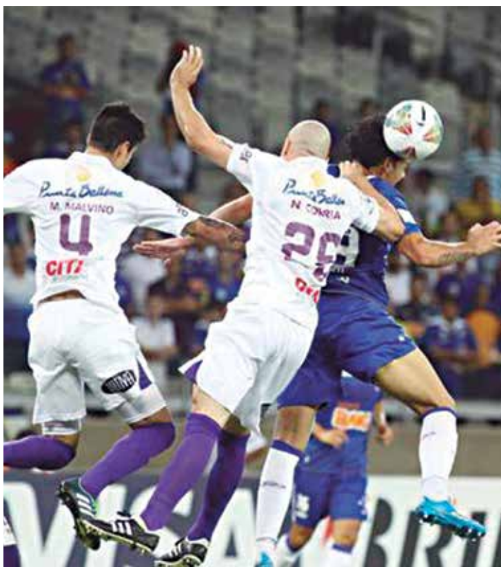
Equipe cruzeirense não conseguiu vencer o Defensor do Uruguai

resultado foi terrível, desastroso, tínhamos 2 a 0 com volume e controle. Mas não acabou. Somos profissionais, vamos absorver, e dependemos de duas vitórias, acredito, para classificar. Temos condições, pelo que o time demonstrou”, afirmou Marcelo Oliveira.