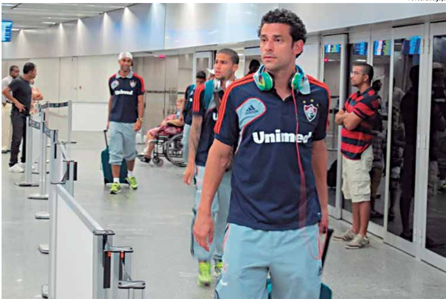
No desembarque, no Aeroporto Tom Jobim, jogadores do Fluminense ficaram calados e poucos torcedores foram recepcioná-los

Time perde para o Horizonte e fica em situação difícil