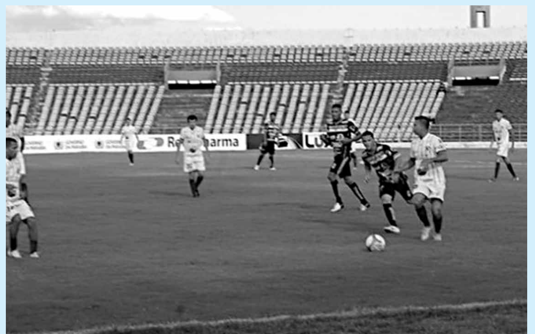
Depois de perder para o Atlético, a equipe do Botafogo pensa na reabilitação contra o CSP