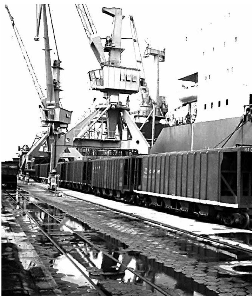
Dragagem na região do porto será feita ainda neste primeiro semestre

Segundo o ministro, também será prioridade a implementação do VTMS (Vessel Traffic Management Information System), sistema de auxílio eletrônico à navega-